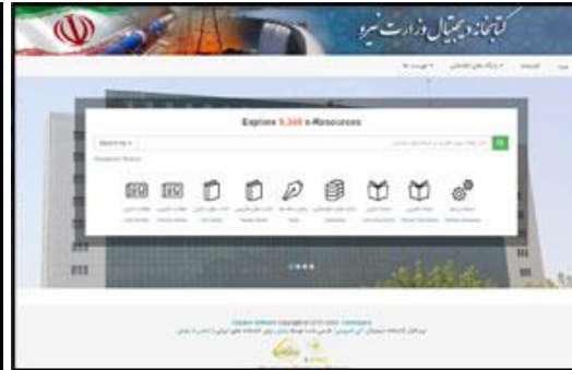
کتابخانه دیجیتال و آرشیو سازمانی وزارت نیرو