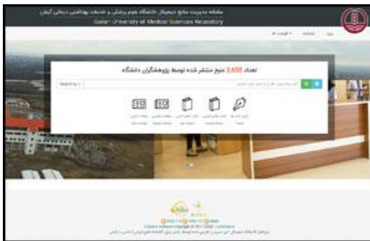
سامانه مدیریت منابع دیجیتال دانشگاه علوم