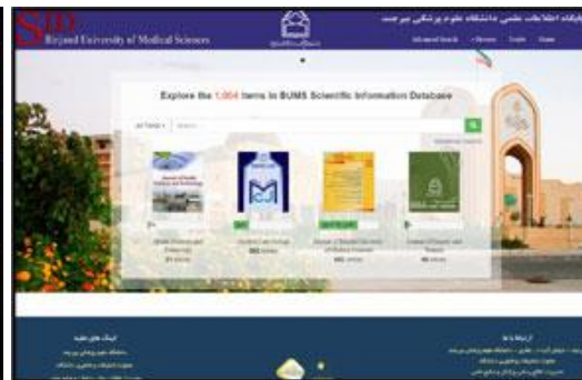
پایگاه اطلاعات علمی دانشگاه علوم پزشکی