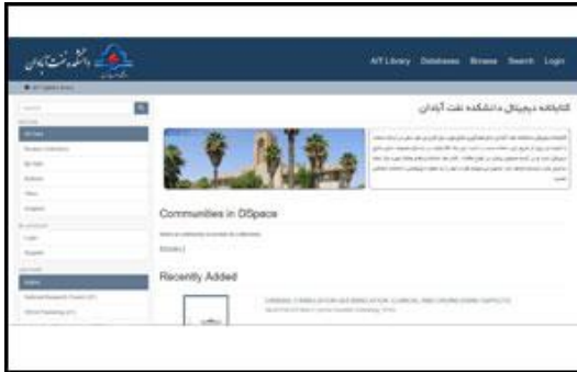
کتابخانه دیجیتال دانشکده نفت آبادان