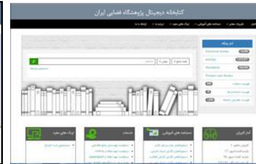
کتابخانه دیجیتال پژوهشگاه فضایی ایران